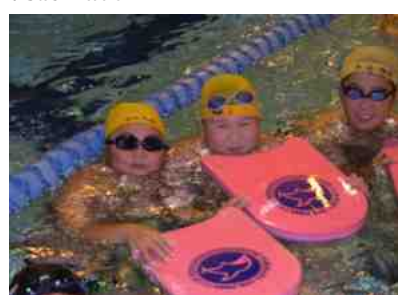
福島県 県庁 ジャマイカ