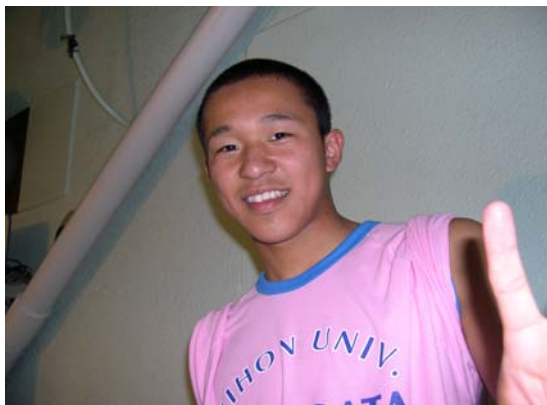
なぞなぞのこたえ